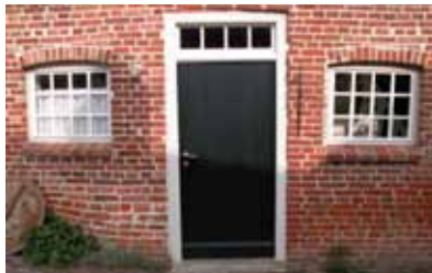
Vorbildlich restauriertes Landarbeiterhaus in Ostfriesland

Selbstverständlich ist, dass gemäß geltendem Steuerrecht nur Personen, die auch Steuern zahlen, eine Steuererstattung in Anspruch nehmen können. Im Einzelfall kann es deshalb unter dem Strich auch zu keiner direkten steuerlichen Förderung kommen, und es ist unbedingt empfehlenswert, die persönlichen Vorteile vorab von einem Steuerfachmann prüfen zu lassen.